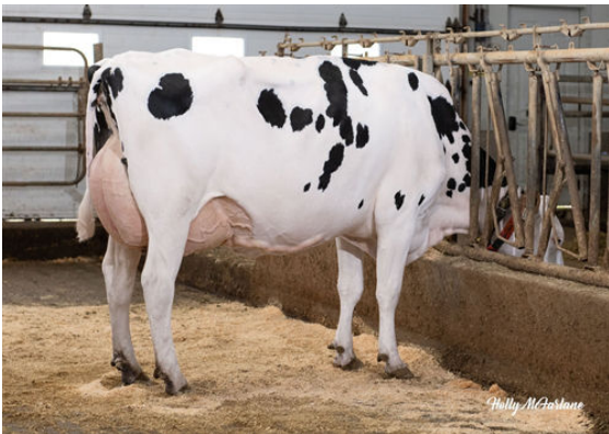
PROGENESIS FABULOUS DAIQUIRI DAUGHTER