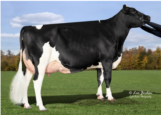
AOT FABULOUS HENLEY DAUGHTER